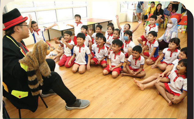
More than 2,500 K2 children have benefitted from this initiative.