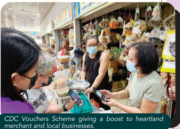
CDC Vouchers Scheme giving a boost to heartland merchant and local businesses.