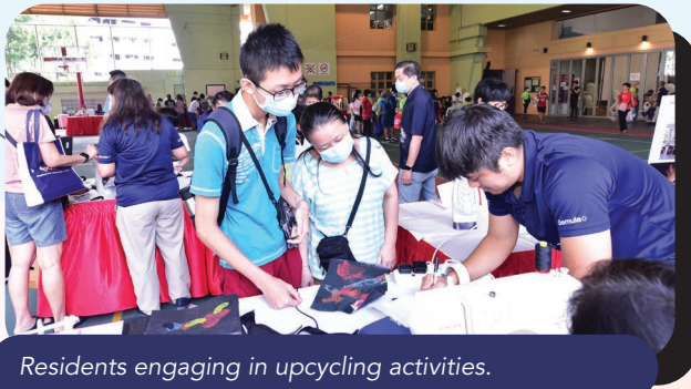
Residents engaging in upcycling activities.