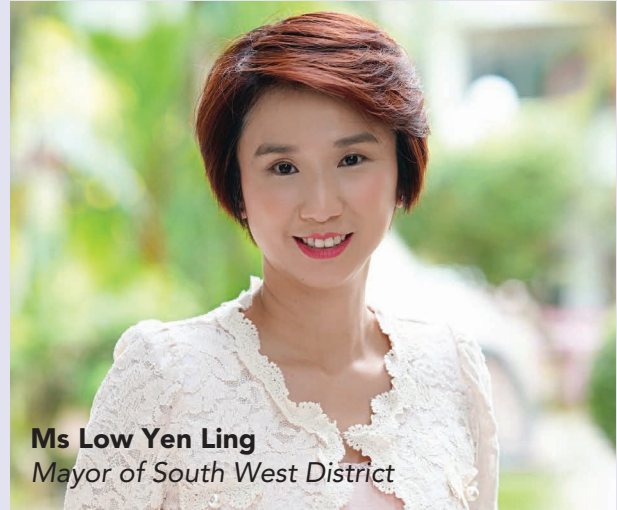
Ms Low Yen Ling Mayor of South West District

As we leverage our collective strengths to build a caring, inclusive and cohesive South West District, we can proudly call "Our South West, Our Home"!