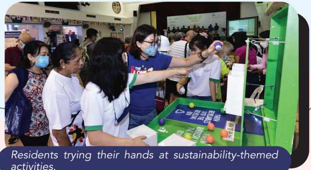
Residents trying their hands at sustainability-themed activities.

Fun Walkers @ South West was designed to promote active ageing and healthy lifestyles among residents. Open to all residents, activities include regular walking sessions, unique nature trails and community events that can foster stronger family and community bonding.