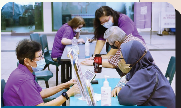
Training partners were present on-site to provide job-seekers with consultations and information about upgrading options.