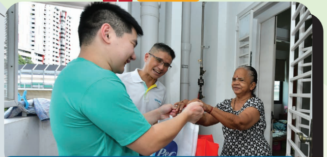
About 50 volunteers from MINDS helped pack and distribute festive packs to 8,000 households.