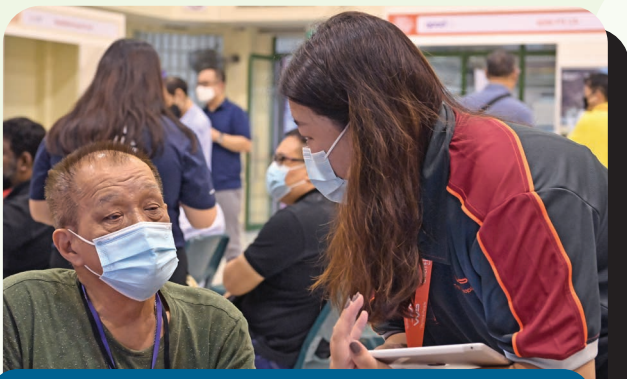
The inaugural all-inclusive Community Job Fair for the visually impaired was held in conjunction with National White Cane Day.