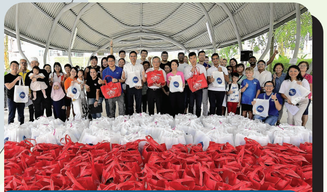
Procter & Gamble marking the fourth year of partnership with South West CDC for Festive Cheers @ South West.